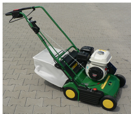
Honda GP160 motorral, fűgyűjtő zsákkal

A gép igen hosszú életű, erős gép. Kertjüket rendszeresen gondozóknak javasoljuk. A fűgyűjtőzsák nem tartozék, de opcióként 55 literes fűgyűjtőzsák is rendelhető.